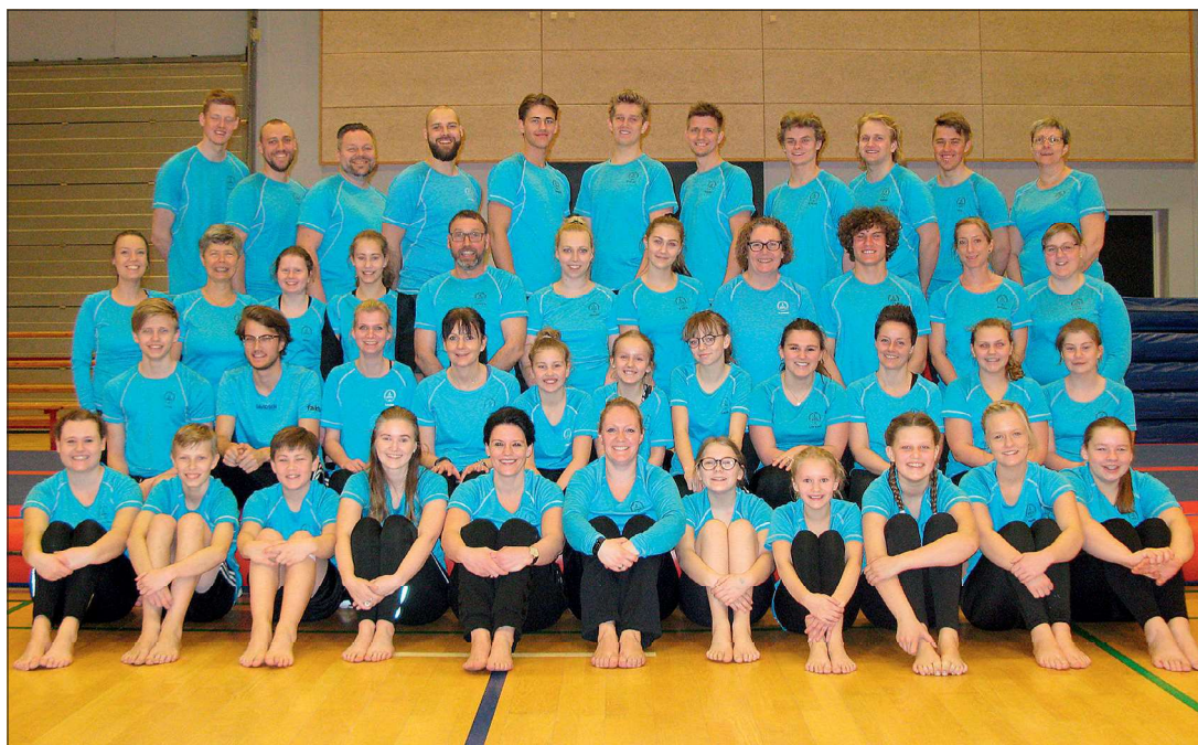
Instruktørholdet fra 2016.

I 2004 lavede vi for første gang Ryste-sammen-weekend for børneholdene fra 2. klasse og op. Her mødte gymnasterne op kl. 19 og sprang hele aftenen samt lavede forskellige lege og var på stjerneløb. Gymnasterne sov på skolen og blev hentet dagen efter. Alle hjælpere og instruktører