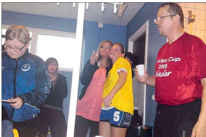
Oprykning til serie 1 damer.