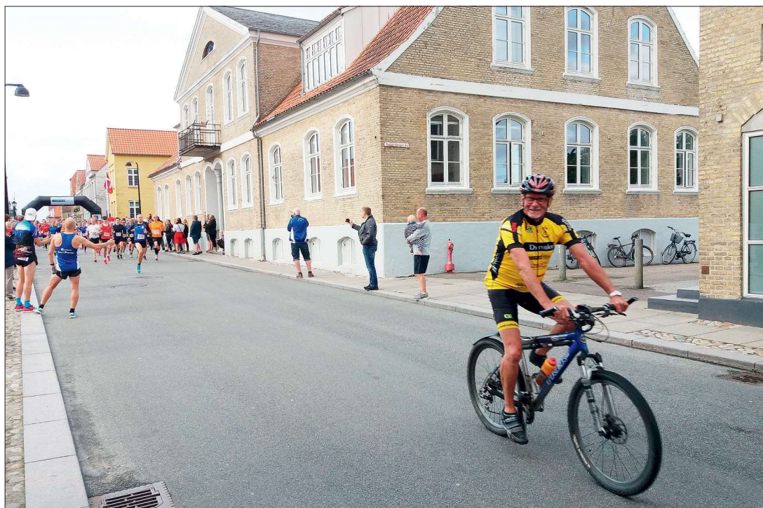
Løb for voksne med CCM rytter som hare ved Vinfestival.