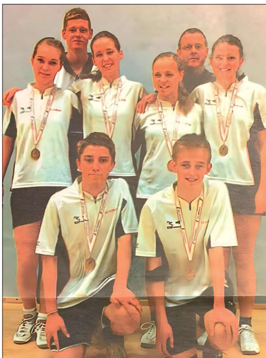
U15 vandt landsmesterskabet i 2012.

I 2014 kom der lidt nyt legetøj - en boldkanon - der skyder fjerbolde af sted med hele 150 km i timen - et fint supplement til træningen.