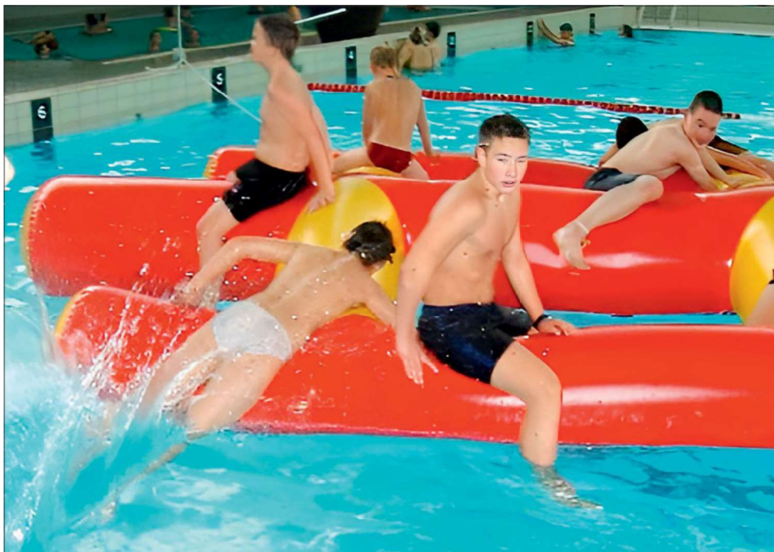
Besøg i svømmehal.

Arrangementer, der var stor tilslutning til og som blev gentaget flere gange.