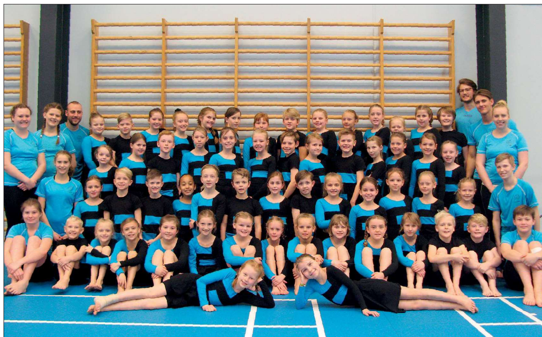
Stort Kidsmix fra 2017.