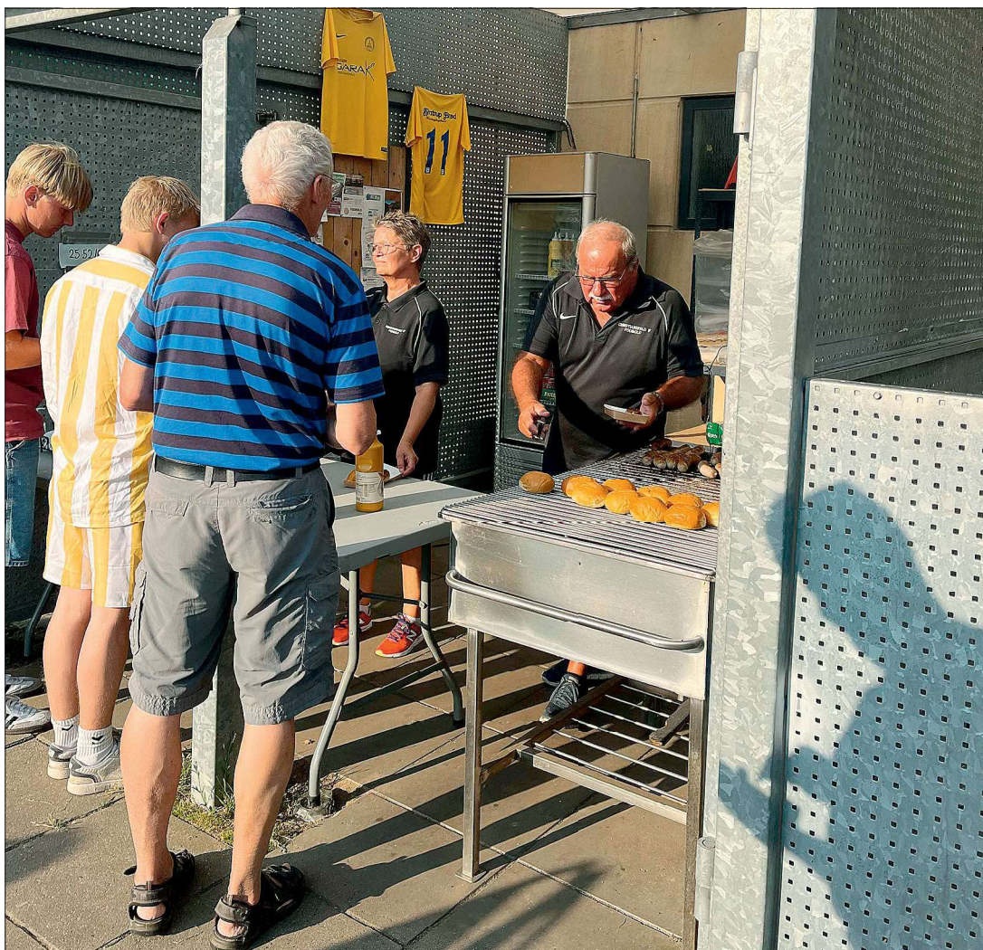
Gang i grillen ved Cuben.

Seniorfodbolden var gået helt i stå i 2007 helt uden hold. Men i 2008 startede nye kræfter op med et serie 5 hold. Et hold af "Feldere" viste evne og vilje på højeste niveau. Det førte til oprykning på oprykning og kulminerede med oprykning til jyllandsserien i 2013 – "I honningkagebyen er oprykning hverdagskost" lød overskriften i Jysk fodbold magasin i juli 2013. Efter at have klaret sig flot i første sæson i jyllandsserien, stod den på serie 1 igen i foråret 2015.