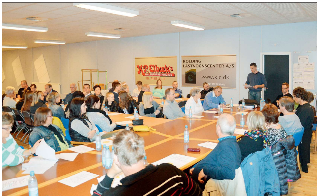
Generalforsamling i HB 2014.

Tiden i perioden fra 2011 og frem til 2013 var præget af finanskrisen, hvilket